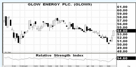
กราฟแนวโน้มราคาหุ้น GLOW