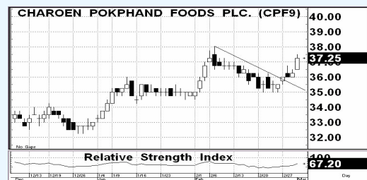
ภาพแนวโน้มราคาหุ้น CPF