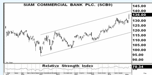
กราฟแนวโน้มราคาหุ้น SCB

กำไรสุทธิปี 54 เติบโตขึ้นถึง 50% yoy ที่ 36,300 ล้านบาท จากรายได้จากสินเชื่อที่โตถึง 27% บวกกับกำไรพิเศษอีกกว่า 5,000 ล้านบาท ทำการตั้งสำรองในไตรมาส 4/54 ที่ 3,070 ล้านบาท (+64% qoq) เพื่อป้องกัน NPL ที่อาจเพิ่มขึ้นสูงขึ้นจากผลกระทบน้ำท่วม... ROE มีการปรับตัวดีขึ้นอย่างต่อเนื่องจาก 16% ในปี 53 เป็น 18% ในปี 54... ราคาพื้นฐาน 138 บาท