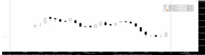
ภาพ SET ราย 5 นาที ณ เวลา 12.30 น.

ตลาดบ้ายแรง บ้ายนี้อาจซึบจนติดลบต่ำกว่า 1,158 จุด แะขยายหุ้นแพงเกินพื้นฐาน เปลี่ยนไปซื้อหุ้นที่มี Upside เพียง DTAC(FV@B82.6) แะ SC(FV@B17.82) สำหรับหุ้นเทคนิคติดตรกฎ เน้นรุ่น S-Class SVI, SC, SMART