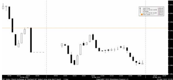
ภาพ SET ราย 5 นาที ณ เวลา 12.30 น.

สัญญาณการปรับลดลงในวันนี้ อาจเป็นจุดเริ่มต้นของการปรับฐานใหญ่ รอดูการทดสอบ 1,178 จุด ต่ำกว่านี้ดัชนีอาจถึงคราวฟูบวยาว แนะนำหุ้นแพงเกิน Fair Value ปี 2555 12 หุ้นแรกคือ BIGC, SGP, HMPRO, THCOM, TIPCO, BEC, SF, AOT, BCP, TMB, ROBINS, BAY และรอซื้อ กลุ่มยานยนต์/สินค้า SAT, STANLY, TCAP, TK อสังหา SPALI