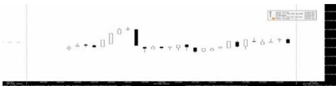
ภาพ SET ราย 5 นาที ณ เวลา 12.30 น.

SET พัดลบเพื่อพบรัก ทยอยไม่ต่ำกว่า 1,107 จุดก่อนติดตัวขึ้นทดสอบ 1,120 เก็บ Global Plays PTTEP, BANPU, SCC, PTGC, CPF, IVL และหุ้นเทคโนโลยีดาว THAI, AMATA, SC, SCB