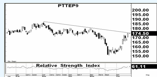
กราฟแนวโน้มราคาหุ้น PTTEP

คาดการณ์ว่าราคาหุ้นจะยังแข็งแกร่งในไตรมาส 2/55 แม้ PTTEP มีกำหนดปิดปรับปรุงโรงผลิตก๊าซที่สำคัญ อาทิ แหล่งบงกช Yadana และ Yetagun แต่ก็ยังคงได้รับการชดเชยจากการผลิตเชิงพาณิชย์ของแหล่ง Bongkot South (กำลังการผลิตที่ 300mmscf ที่คาดว่าจะเริ่มดำเนินการผลิตได้ในเดือน พ.ค.-มิ.ย.55) นอกจากนี้ PTTEP ยังปรับเพิ่มราคาขายเฉลี่ยของก๊าซขึ้นอีกประมาณ 10% จากอัตราปัจจุบันที่ 7.1 เหรียญสหรัฐฯ/mbtu... ราคาพื้นฐาน 175 บาท