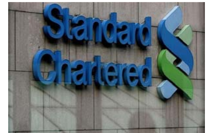
ราคาหุ้น Standard Chartered Bank เทียบกับ Eurostoxx Financial Index