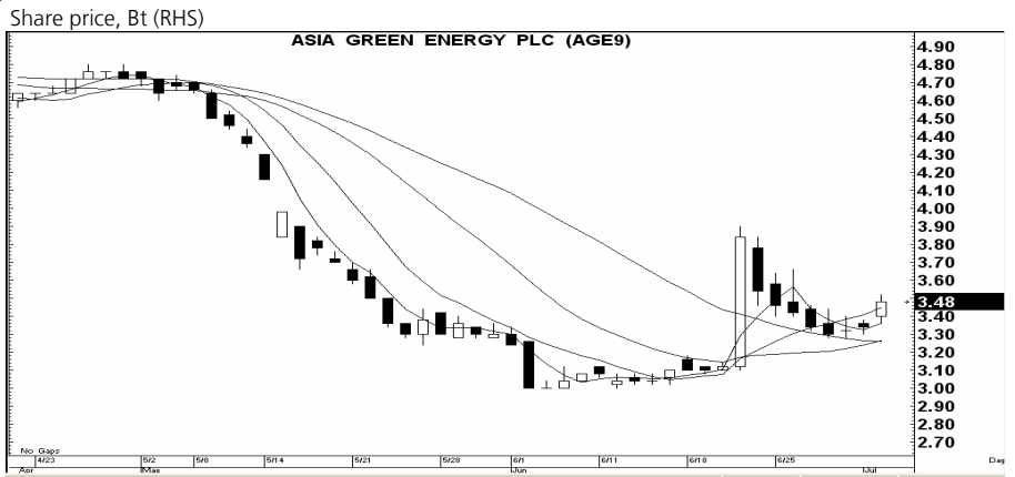
กราฟทางเทคนิคหุ้น AGE ราคาปิดเมื่อวาน 3.48 บาท