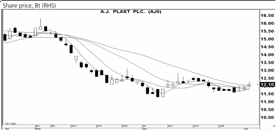
กราฟทางเทคนิคหุ้น AJ ราคาปิดเมื่อวาน 12.10 บาท

AGE (3.48 บาท) สัญญาณ: ชี้อ เครื่องชี้: ดบ แนะนำ: เก็งกำไรเร็ว ความเห็น: แรงเหวี่ยง 3.60; ให้ ขายตัดขาดทุนหาก ราคาต่ำกว่า 3.44