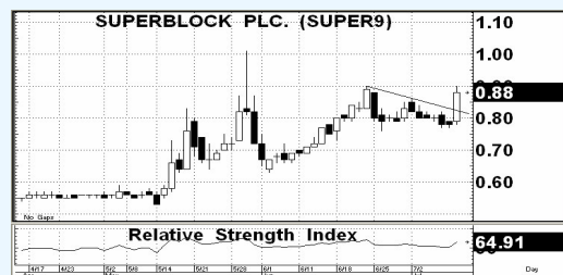
กราฟแนวโน้มราคาหุ้น SUPER

การปรับตัวขึ้นแรงหลังการผ่านแนวต้านระยะสั้นที่ 0.80-0.82 ขึ้นมาในวันวาน พร้อมกับปริมาณ Volume ที่หนาตาขึ้นอย่างมีนัยสำคัญ ขณะที่สัญญาณจากค่า Indicator กลับมาปรับตัวขึ้นเข้าเชิงบวกมากขึ้น ยังคงคาดหวังแนวโน้มที่ดีในระยะสั้นต่อไปได้ ..