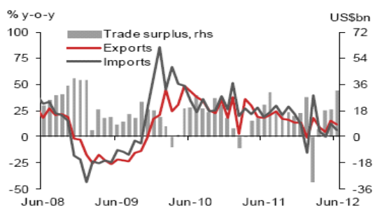
Fig. 1: Trade growth and trade balance