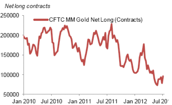
Fig. 3: Speculator interest has declined