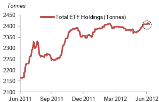
Fig. 2: Gold ETF holdings close to record levels