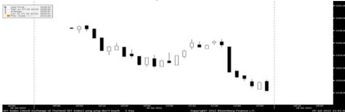
ภาพ SET ราย 5 นาที ณ เวลา 12.30 น.

เล่นแรง ถึงกับร้องเสียงหลง สื่อสาร บันเทิง ธนาการฯ โดน Take ไม่ยั้ง มองตลาดยังไม่แย้ เพราะมีการสลับขายตัวแพงและไปซื้อของใหญ่และถูกอย่าง กลุ่มพลังงาน ปีโตรฯ อีกทั้งยังมีแรงซื้อเก็งกำไรใน Domestic สิ้นเชื่อเข้าซื้อ ยานยนต์ ที่ PER ยังไม่แพงมากเป็นตัวแทน เชื่อว่าไม่นานตลาดจะดีดกลับ 1,248 จุด กลยุทธ์เน้นแบบผสม Global & Domestic Plays และ Earning Momentum PTT, TOP, TCAP, KTB, TK, SC, CPN, NWR, SRICHA ส่วนหุ้นเทคนิคคิดกันเอง BJC, DRT, SIAM