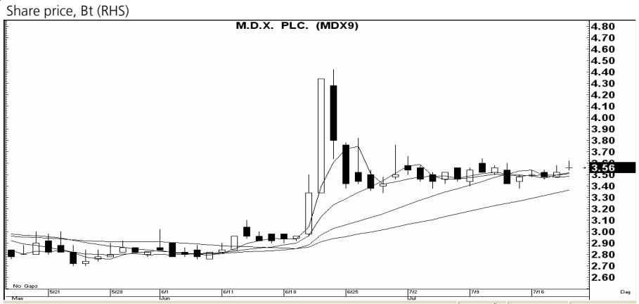
กราฟทางเทคนิคหุ้น MDX ราคาปิดเมื่อวาน 3.56 บาท