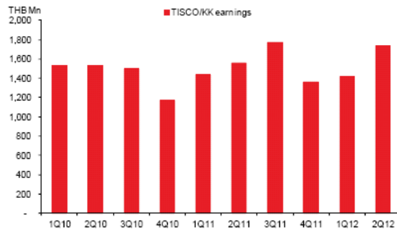
Fig. 10: TISCO/KK: Quarterly earnings