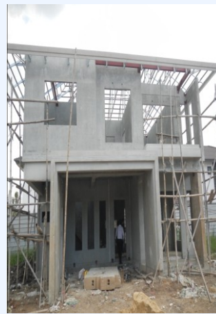
ประกอบใช้เวลาเพียง 1 เดือน