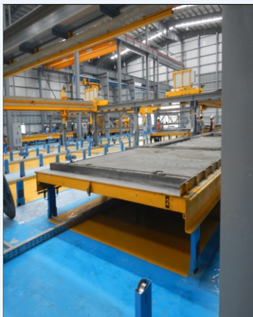
เทซีเมนต์เพื่อทำแผ่น Precast