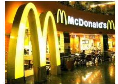
ราคาหุ้น MCD ย้อนหลัง