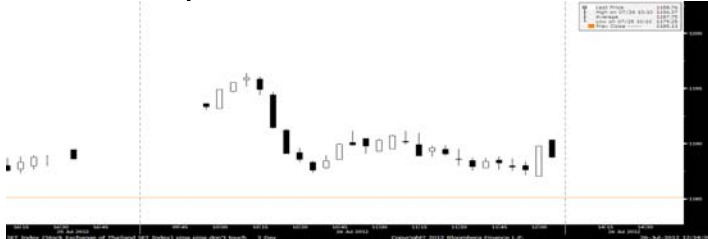
ภาพ SET ราย 5 นาที ณ เวลา 12.30 น.

วิกฤตกรีซและสเปนอาจใกล้ถึงจุดปรอทแตก ควรเพิ่มความระมัดระวัง และให้ใช้กลยุทธ์รักษาตัวรอดเลือก Dividend Plays KCAR, SNC, TTW, RATCH, SAT ส่วนหุ้นเทคนิคจิตพิศवास PJW, TTCL