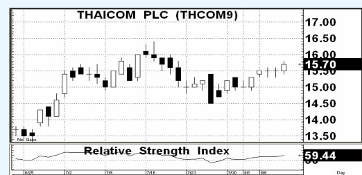
กราฟแนวโน้มราคาหุ้น THCOM