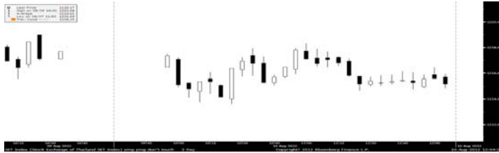
ภาพ SET ราย 5 นาที ณ เวลา 12.30 น.

SET เข้าสู่โหมดพักตัว มองแนวรับสำคัญที่ 1,210 หรือต่ำสุดก็ไม่ต่ำกว่า 1,200 จุด โดยดัชนียังมีโอกาสขึ้นทดสอบ 1,228 และ 1,248 สำหรับกลยุทธ์ยังให้ถือ+ซื้อ PTT(FV@B390) และ สลับขาย TOP, IVL เพื่อไปซื้อ Domestic จ่ายปันผลจาก TK, KCAR, EASTW ส่วนหุ้นเทคนิคบ้าย ยังให้ตามติดกับ THCOM