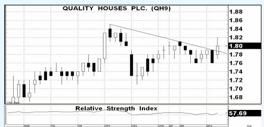
กราฟแนวโน้มราคาหุ้น SVI