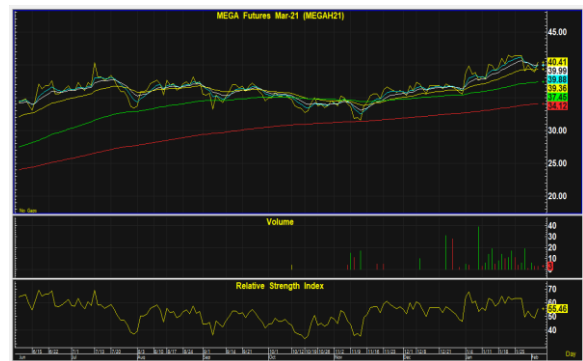
MEGAH21 มีลุ้นแกว่งขึ้น

ระยะสั้นเป็นการแกว่งตัวเพื่อปรับตัวขึ้น หากแม้อย่างไม่หลุดต่ำกว่าแนวรับที่ 38-37 ที่เป็น stop ประเมินแนวต้านที่มีโอกาสทดสอบที่บริเวณ 45 คำแนะนำ เก็งกำไรเปิด Long ตามหากยังไม่หลุดต่ำกว่า 38-37 ที่เป็น stop มีโอกาสแกว่งตัวขึ้นทดสอบ 45