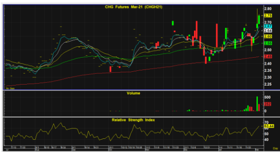
CHGH21 ลุ้นเบรคขึ้น

มีโอกาสแกว่งตัวขึ้น หลังจากพักฐานมานาน และระยะกลางเริ่มสร้างฐานมีโอกาสแกว่งตัวขึ้น หากแม้อย่างไม่หลุดต่ำกว่าแนวรับที่ 2.6 ที่เป็น stop มีโอกาสเป็นแกว่งตัวขึ้นเพื่อทดสอบที่บริเวณ 2.9-3.00 คำแนะนำ เก็งกำไรเปิด Long หากยังไม่หลุดต่ำกว่า แนวรับที่ 2.6 ที่เป็น stop มีโอกาสแกว่งตัวขึ้น ทดสอบแนวต้าน 2.9-3.00