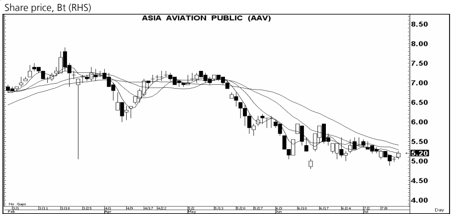
กราฟทางเทคนิคหุ้น AAV ราคาปิดเมื่อวาน 5.20 บาท

AAV (5.20 บาท) สัญญาณ: ชี้อ เครื่องชี้: ดี แนะนำ: เก็งกำไรเร็ว ความเห็น: แรงเหวี่ยง 5.50; ให้ ขายตัดขาดทุนหาก ราคาต่ำกว่า 5.10