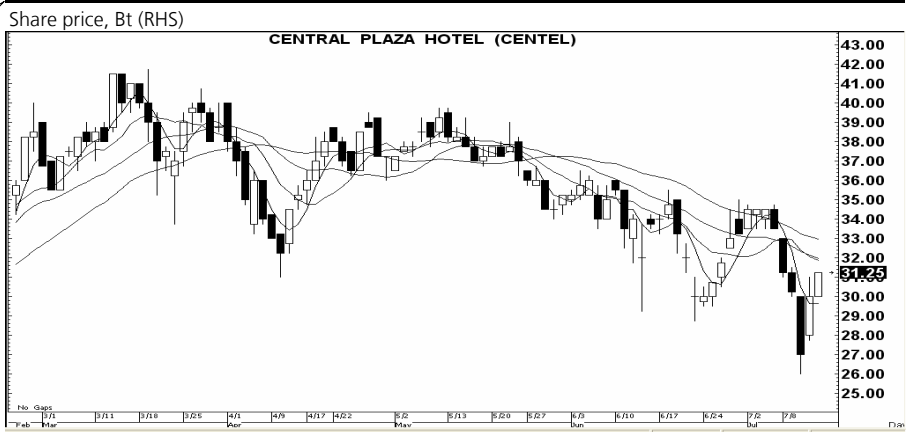
กราฟทางเทคนิคหุ้น CENTEL* ราคาปิดเมื่อวาน 31.25 บาท

CENTEL* (31.25 บาท) สัญญาณ: ชี้อ เครื่องชี้: ดี แนะนำ: เก็งกำไรเร็ว ความเห็น: แรงเหวี่ยง 33; ให้ขาย ตัดขาดทุนหากราคา ต่ำกว่า 30.25