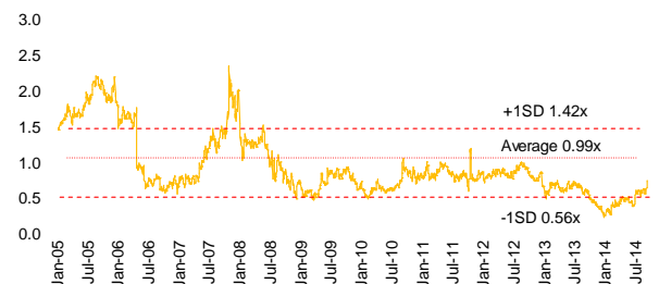
Figure 2: Core business trading below average PBV at 1.0x