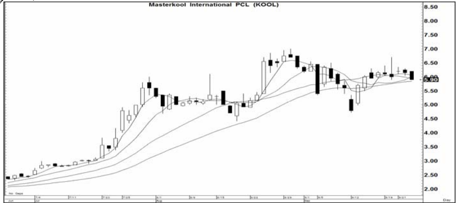
กราฟทางเทคนิคหุ้น KOOL ราคาปิดเมื่อวาน 5.90 บาท Share price, Bt (RHS)

สัญญาณ: ชี้อแนวรับ เครื่องชี้: กลาง แนะนำ: เก็งกำไรเร็ว ความเห็น: แรงเหวี่ยง 6.25; ให้ ขายตัดขาดทุนหาก ราคาต่ำกว่า 5.80